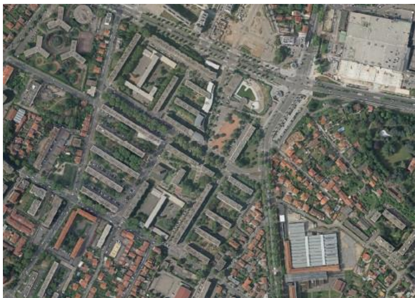
Réhabilitation Bâtiment B Mermoz

De la valorisation du patrimoine bâti aux enjeux environnementaux pour la reconstruction d'un écosystème vertueux en passant par la ré-interrogation des relations physiques et sensorielles entre espaces publics et privés... les défis posés par le projet sont nombreux ! L'enjeu ? Faire du quartier Mermoz-Sud un lieu d'expérimentation et d'innovation en termes de réhabilitation.